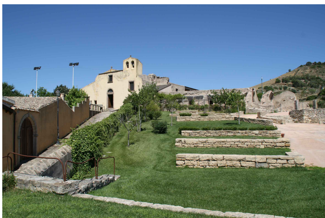
Vista della chiesa Madonna del Sacro Cuore e del Convento.