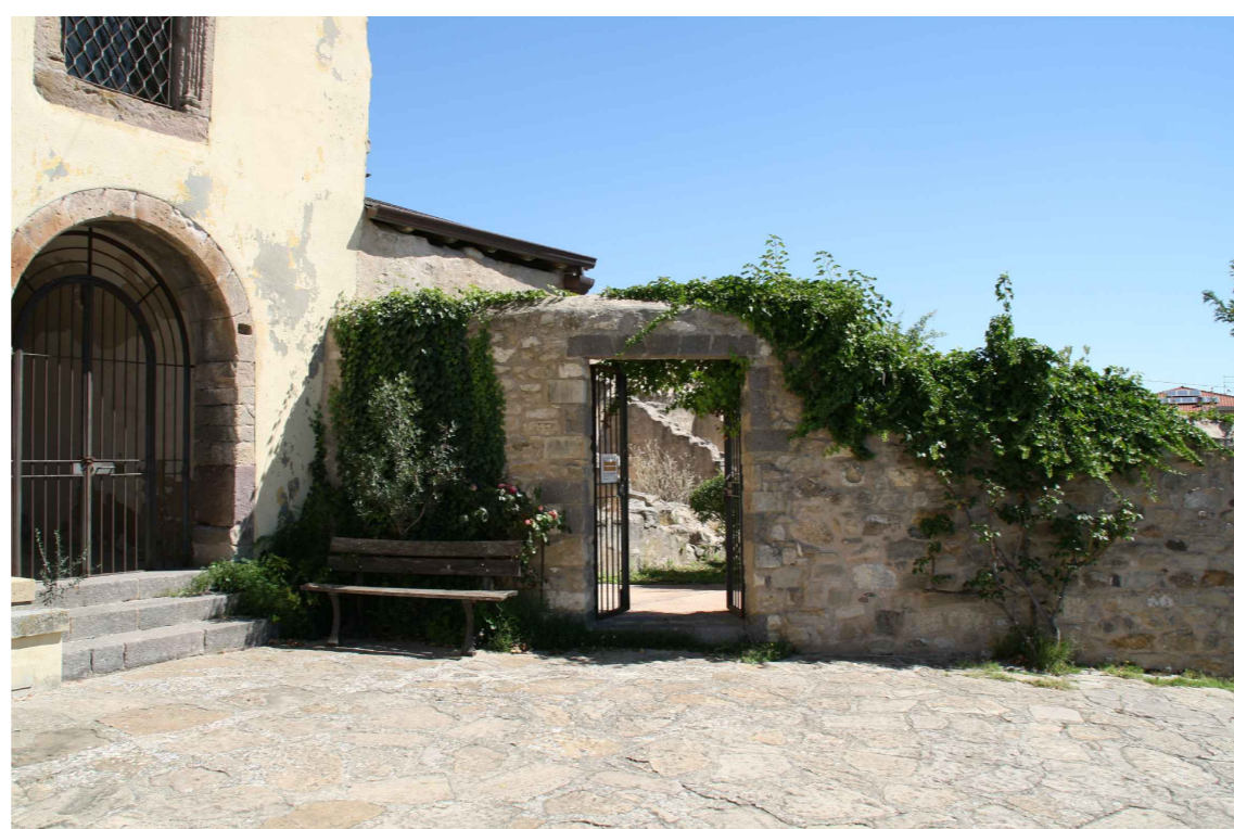
Particolare della pavimentazione esterna.